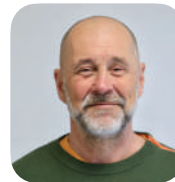
Yves KLEIN (L'Union)