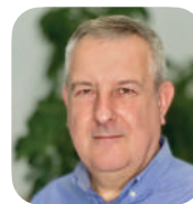
Christophe NIEULAC (TF1)