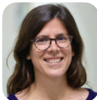
Gwenaël BOURDON (Le Parisien)