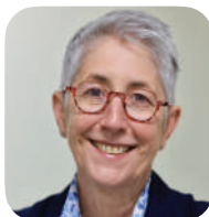
Mona BLANCHET (Le Dauphiné libéré)