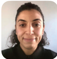
Wafaa ESSALHI (AFP)