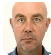
Anthony ORLIANGE (CAPA PRESSE)